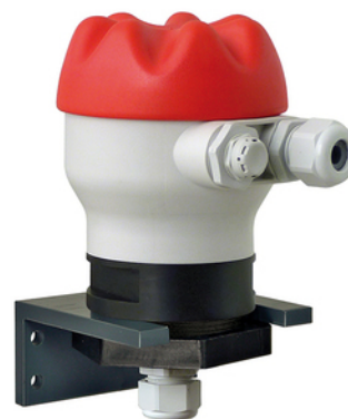
BJSC Equerre de fixation PVC