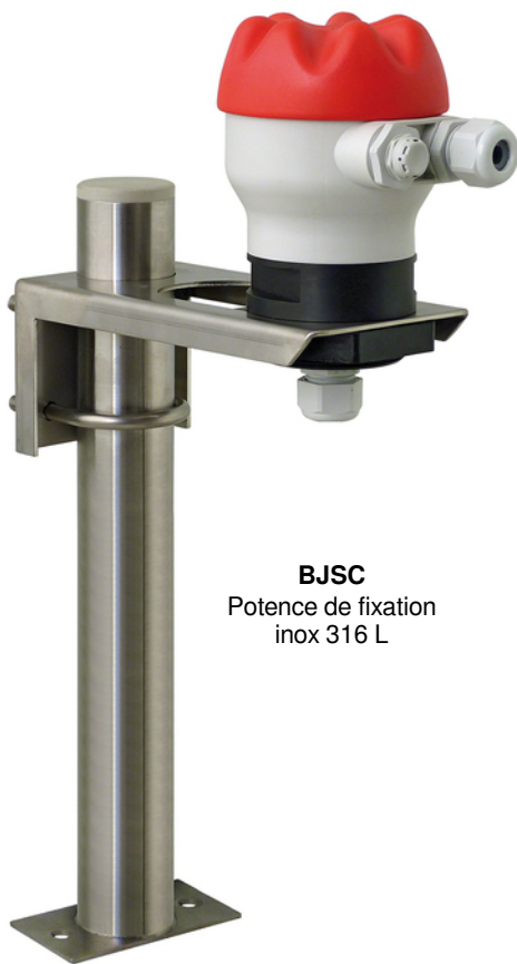
BJSC Potence de fixation inox 316 L

Pour une fixation sur un support plan ou pour une fixation murale lorsqu'il n'y a pas de taraudage 2"G, différents supports peuvent être utilisés.